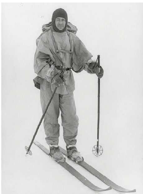
Hudson (†1612), Scott vgl. Abb. (†1912), Henry Hudson Amundsen (†1928). https://de.wikipedia.org/wiki/Robert_Falcon_Scott https://de.wikipedia.org/wiki/Roald_Amundsen